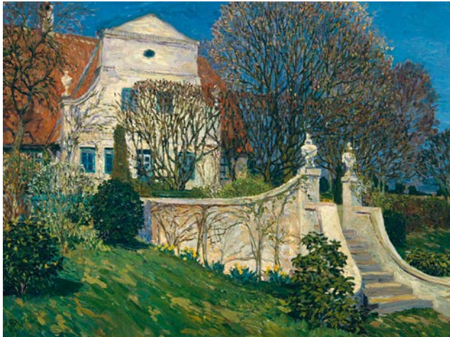
Der Barkenhoff, 1904, Ölbild

Heinrich Vogeler – ein deutsches Schicksal, das mit einer wohlbehüteten Kindheit vor 150 Jahren begann und 1942 in einem Kolchos bei Kornejewka in Kasachstan ein tragisches Ende fand. Der gebürtige Bremer war Maler, Grafiker, Architekt, Designer, Pädagoge und Schriftsteller. In jungen Jahren zieht es ihn nach Wörpswede, wo er im „Barkenhoff“ residiert und der Jugendstilbewegung eindrucksvolle Beiträge schenkt. Sein Leben inszeniert er als Kunstwerk, gilt dem Bürgertum als „liebstes Kind“. Doch sein Traum, Kunst und Leben in Einklang zu bringen, erweist sich als brüchig. Privat und künstlerisch gerät er nach 1900 zunehmend in eine Krise. Im August 1914 folgt er freiwillig dem „Ruf der Waffen“. Doch die Grausamkeit des Völkermordens erschüttert ihn, und in einem christlich-ethischen Appell fordert Vogeler den deutschen Kaiser Wilhelm II. im Januar 1918 auf, den Krieg zu beenden – und landet für einige Wochen in einer Irrenanstalt. Fortan engagiert er sich für eine Welt, die auf Frieden, Freiheit und sozialer Gerechtigkeit beruhen soll, wird verleumdet und verfolgt. 1919 gründet er auf dem „Barkenhoff“ in Wörpswede eine Kommune und Arbeitsschule, aber das Experiment scheitert. 1924 übergibt er das Haus der „Roten Hilfe“, die darin ein Heim für Kriegswaisen und für Kinder einrichtet, deren Eltern aus politischen Gründen in Haft geraten sind.